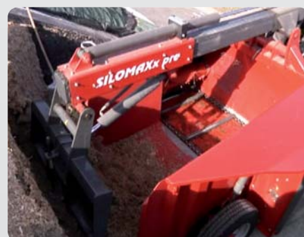
Ansetzen - Drücken - Fertig