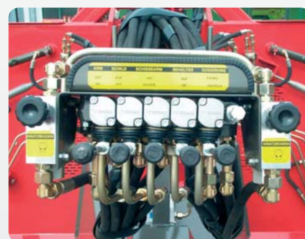
Bedienpult mit Mengenteilern