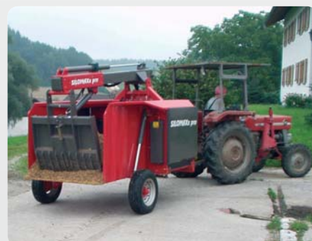
Schon ab 20 PS einsatzbereit