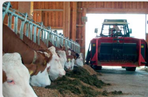
Rechts und links Dosierung serienmäßig!